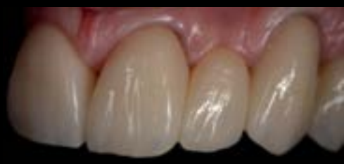
Figura 4: Vista vestibular da ponte de 6 elementos cimentada na boca do paciente.