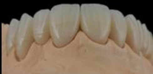
Figura 2: As duas pontes no modelo após a ultra-microestratificação com CERABIEN™ ZR FC Paste Stain (Kuraray Noritake Dental Inc.).