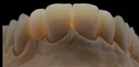
Figura 3: Translucidez à luz transmitida das restaurações caracterizadas e glazeadas.