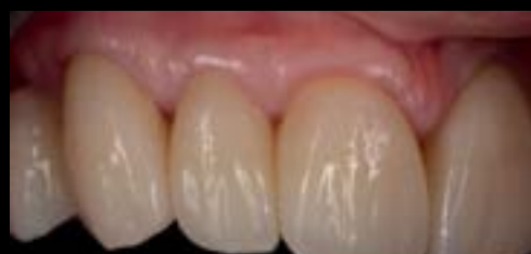
Figura 5: Vista vestibular da ponte de 4 elementos cimentada na boca do paciente.

Com este novo tipo de zircónia multicamadas, é possível produzir restaurações monolíticas estéticas adequadas para utilização na área anterior. Oferecem uma elevada flexibilidade de design apesar da gradação da resistência, e a elevada translucidez na área incisal é responsável por um aspeto natural após a sinterização. A ultra-microestratificação e o glazeamento da superfície monolítica são suficientes para produzir resultados que satisfazem os nossos pacientes.