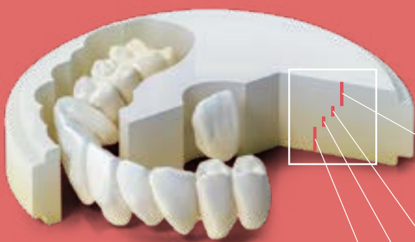
Imagem da gradação

KATANA™ Zirconia YML é uma nova definição de zircónia em medicina dentária. Caracterizada por uma combinação única de matérias-primas de zircónia altamente translúcida com elevada resistência, este material inovador irá capacitar verdadeiramente o seu laboratório dentário. Veja como o pode ajudar a trazer mais eficiência, clareza, simplicidade e precisão aos seus procedimentos sem comprometer a qualidade dos resultados!