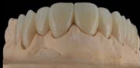
Figura 1: Pontes KATANA™ Zirconia YML de 4 e 6 unidades após fresagem e sinterização. A textura natural da superfície vestibular desempenha um papel decisivo na criação de restaurações monolíticas estéticas.

Normalmente, o potencial estético de um material cerâmico dentário - especificamente a sua translucidez - só pode ser aumentado à custa de uma diminuição da resistência à flexão. O novo KATANA™ Zirconia YML da Kuraray Noritake Dental Inc. é diferente. Com a sua elevada resistência à flexão de 1.100 MPa na metade inferior do disco e elevada translucidez nas áreas incisal e superior de corpo, tem um elevado potencial estético e uma gama de indicações ilimitada, como é demonstrado no seguinte exemplo.